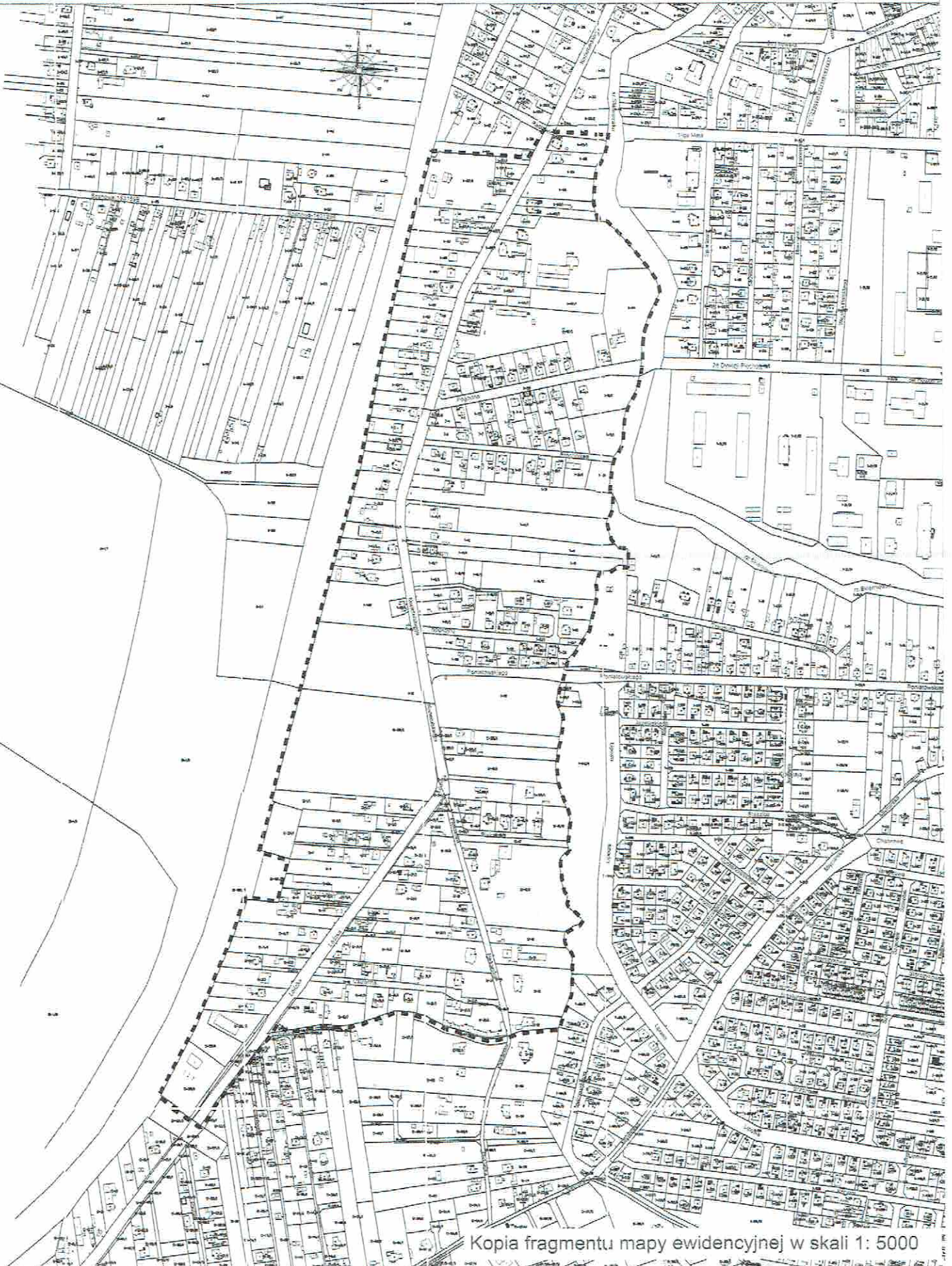
Kopia fragmentu mapy ewidencyjnej w skali 1: 5000

----- - granica obszaru objętego projektem miejscowego planu zagospodarowania przestrzennego